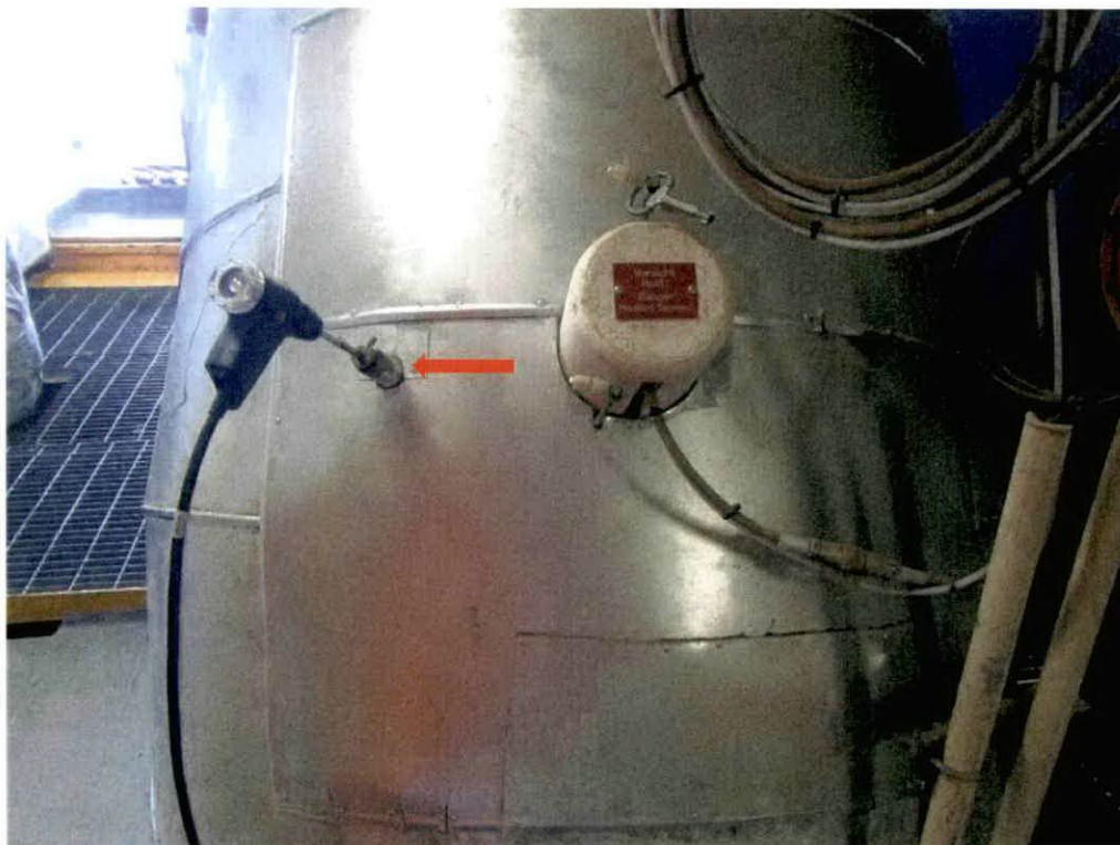
Foto 3 - Punto di campionamento con sonda di prelievo