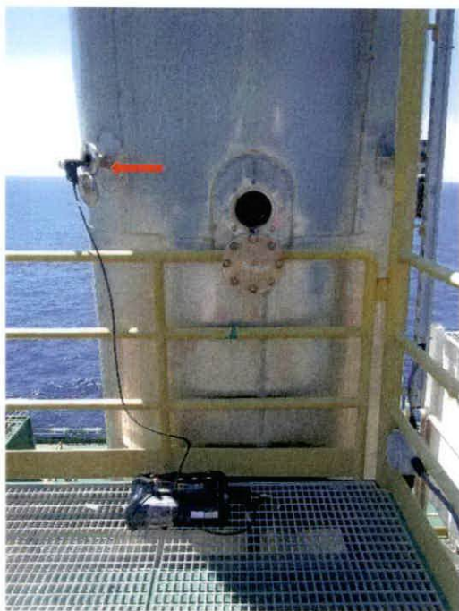
Foto 1 - Punto di campionamento con sonda di prelievo