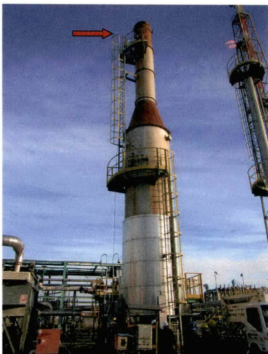
Punto di emissione E1

Il giorno 4 dicembre 2017 sono state effettuate dalle ore 15:20 alle ore 16:30, con l'analizzatore HORIBA PG-350 SRM , misure discontinue 1 nelle condizioni di esercizio più gravose dell'impianto, prelevando i fumi dal camino di scarico di altezza pari a 20 metri. Nella tabella 3 sono riportati i valori misurati delle concentrazioni di CO , NO x , SO x e i rispettivi limiti prescritti nell'Autorizzazione Integrata Ambientale n. 526 rilasciata il 6/09/2006 dalla Provincia di Ravenna per il punto di emissione specifico. I valori riportati sono riferiti alle condizioni normali (273,15 °K e 101,3 kPa) e a un contenuto di O 2 pari al 6%; la temperatura dei fumi rilevata è pari a 870 °C.