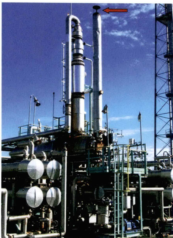
Punto di emissione E12

Il giorno 5 dicembre 2017 sono state effettuate dalle ore 10:20 alle ore 11:30, con l'analizzatore TESTO 350 , misure discontinue nelle condizioni di esercizio più gravose dell'impianto, prelevando i fumi dal camino di scarico di altezza pari a 12 metri. Nella tabella 4 sono riportati i valori misurati delle concentrazioni di CO , NO_x , SO_x , e i rispettivi limiti prescritti nella citata autorizzazione della Provincia di Ravenna per il punto di emissione specifico. I valori riportati sono riferiti alle condizioni normali (273,15 °K e 101,3 kPa) e a un contenuto di O_2 pari al 3%; la temperatura dei fumi rilevata è pari a 158 °C.