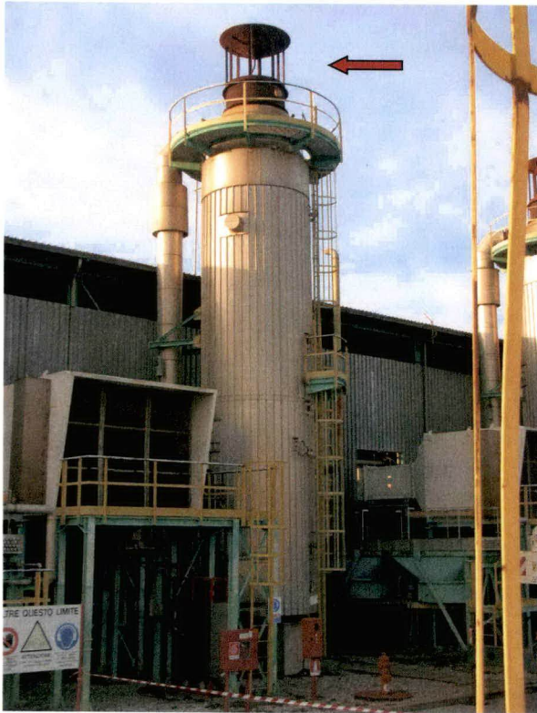
Punto di emissione E19/a

Il giorno 5 dicembre 2017 sono state effettuate dalle ore 9:50 alle ore 11:00, con l'analizzatore TESTO 350 , misure discontinue nelle condizioni di esercizio più gravose dell'impianto, prelevando i fumi dal camino di scarico di altezza pari a 15,5 metri. Nella tabella 3 sono riportati i valori misurati delle concentrazioni di CO , NO_x , SO_x , e i rispettivi limiti prescritti nella citata autorizzazione della Provincia di Ravenna per il punto di emissione specifico. I valori riportati sono riferiti alle condizioni normali (273,15 °K e 101,3 kPa) e a un contenuto di O_2 pari al 15%; la temperatura dei fumi rilevata è pari a 317 °C.