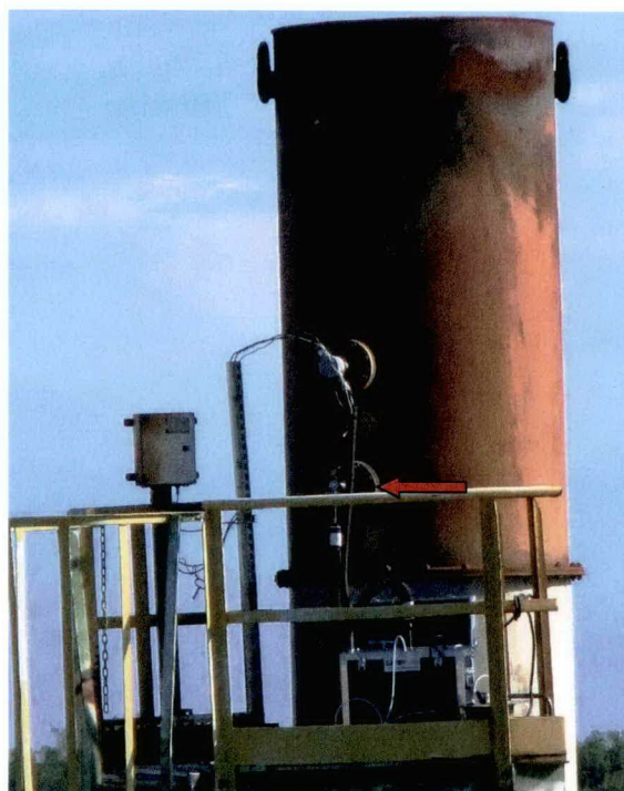
Punto di campionamento con sonda di prelievo