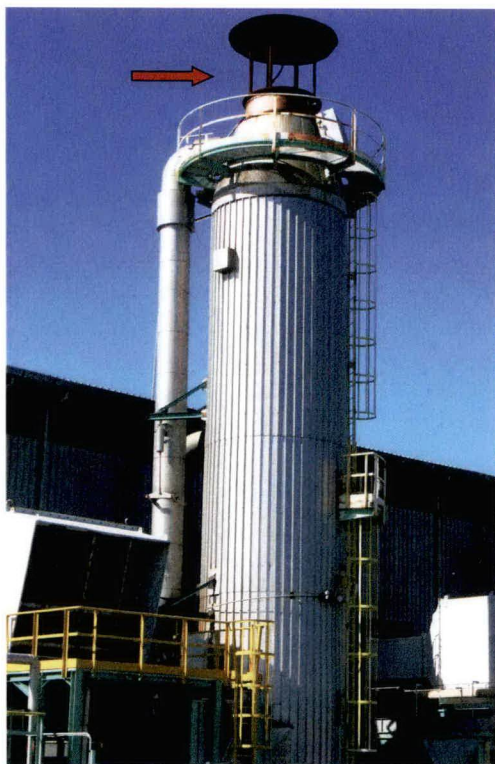
Punto di emissione E18/a

Il giorno 4 dicembre 2017 sono state effettuate dalle ore 15:40 alle ore 16:50, con l'analizzatore TESTO 350 , misure discontinue nelle condizioni di esercizio più gravose dell'impianto, prelevando i fumi dal camino di scarico di altezza pari a 15,5 metri. Nella tabella 2 sono riportati i valori misurati delle concentrazioni di CO , NO_x , SO_x , e i rispettivi limiti prescritti nella citata autorizzazione della Provincia di Ravenna per il punto di emissione specifico. I valori riportati sono riferiti alle condizioni normali (273,15 °K e 101,3 kPa) e a un contenuto di O_2 pari al 15%; la temperatura dei fumi rilevata è pari a 332 °C.