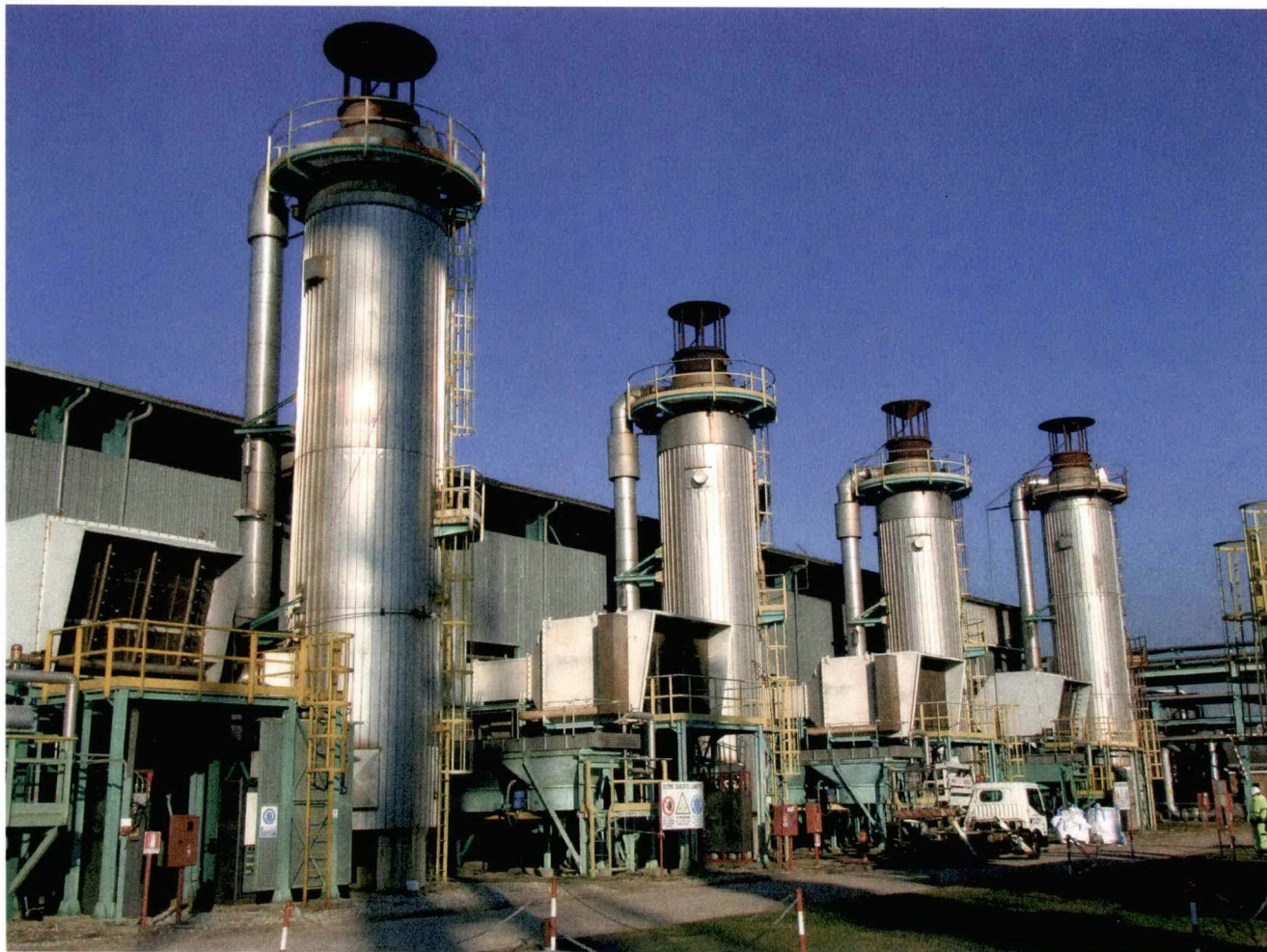
Centrale “Casalborsetti”: turbine di compressione gas Nuovo Pignone KA04, KA03, KA02 e KA01

Controllo delle emissioni in atmosfera nella centrale di produzione e trattamento del gas naturale “Casalborsetti” della società eni. S.p.A., ubicata nel comune di Ravenna in località Casalborsetti.