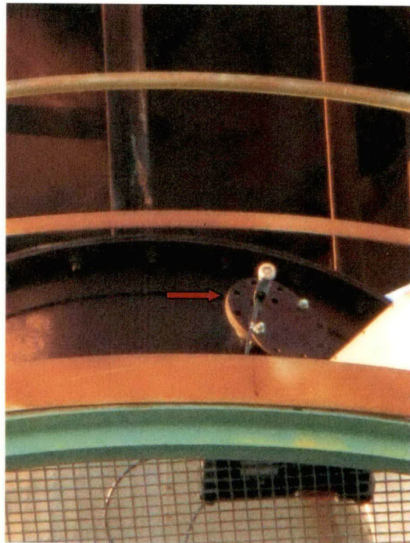
Punto di campionamento con sonda di prelievo